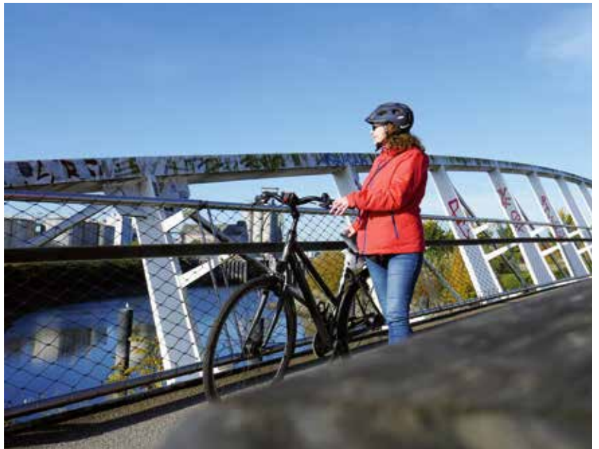
An der Alten Schleuse Wilhelmsburg führt eine Radbrücke über den Äußeren Veringkanal

Wo könnte meine Tour rund um die Elbinseln also passender starten als im 1911 eröffneten Elbtunnel? Wie schon anno dazumal tausende Arbeiter auf dem Weg zur Hafenschicht, radle auch ich durch Europas ersten Flusstunnel – begleitet von den legendären „Tunneltieren“. Die jüngst kunstvoll restaurierten Keramikfliesen zeigen maritime Motive wie Muscheln und Aale, Schweinswale und Seesterne und verschönern die Elbunterquerung. Am Südufer hievt uns ein Aufzug zurück ans Tageslicht. Um den Schachtbau geradelt: ein Perspektivwechsel. Vom Aussichtspunkt am Bornsteinplatz erblicke ich Hamburgs ganze Pracht. Der Blick wandert von St. Pauli über die Landungsbrücken, hinüber zum Michel, wie die Hamburger Hauptkirche St. Michaelis liebevoll genannt wird, bis zur HafenCity mit ihrer funkelnden Elbphilharmonie, dem neuen Wahrzeichen der Stadt. Fähren schaukeln über das kabbelige Wasser, eine milde Brise umweht die Nase. Sie trägt den „Duft der großen weiten